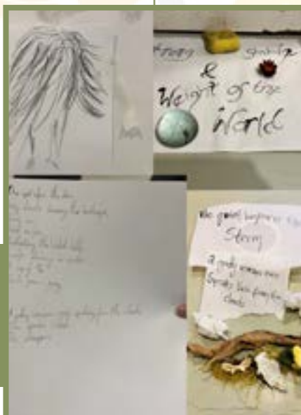
Images from a session in March where the participants looked at making and responding to forgottenplaces/unseen places in the space.